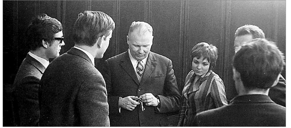
♦ Profesor ze studentami na Uniwersytecie Warszawskim w 1971 r.