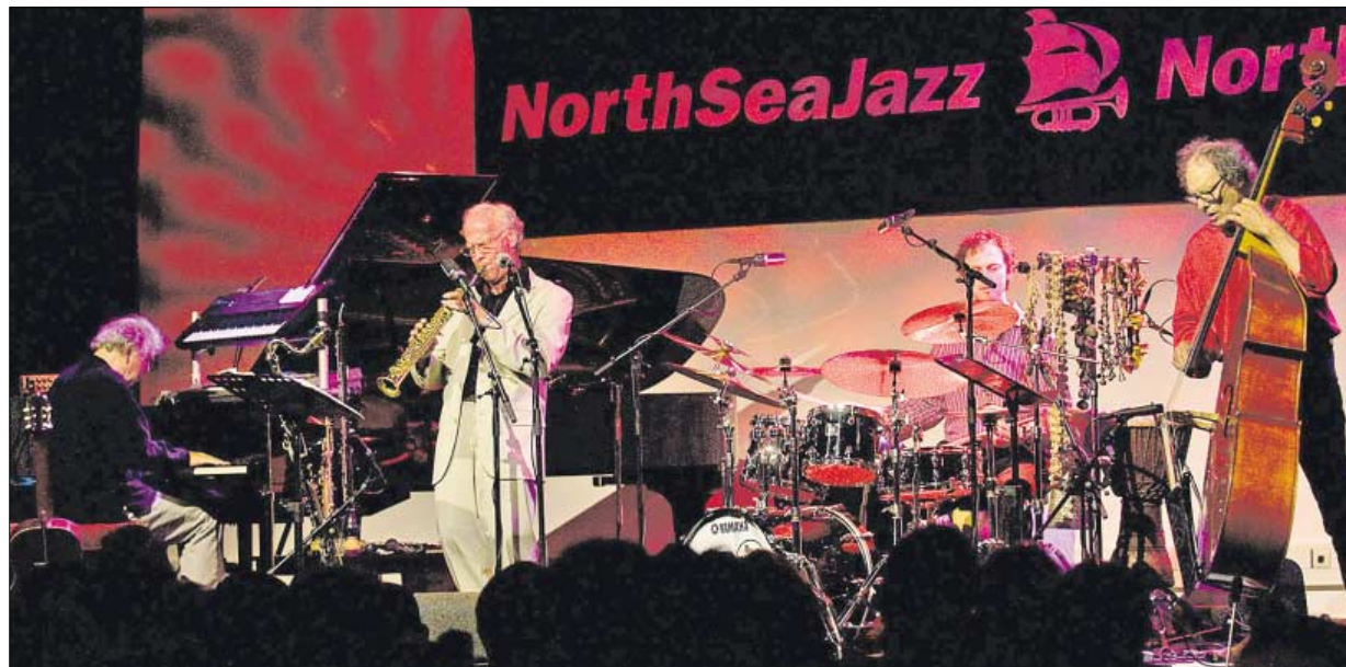
◀ Występ zespołu Oregon w Rotterdamie w 2008 r.

Wydarzenie | Oregon to jeden z najbardziej kreatywnych improwizujących zespołów