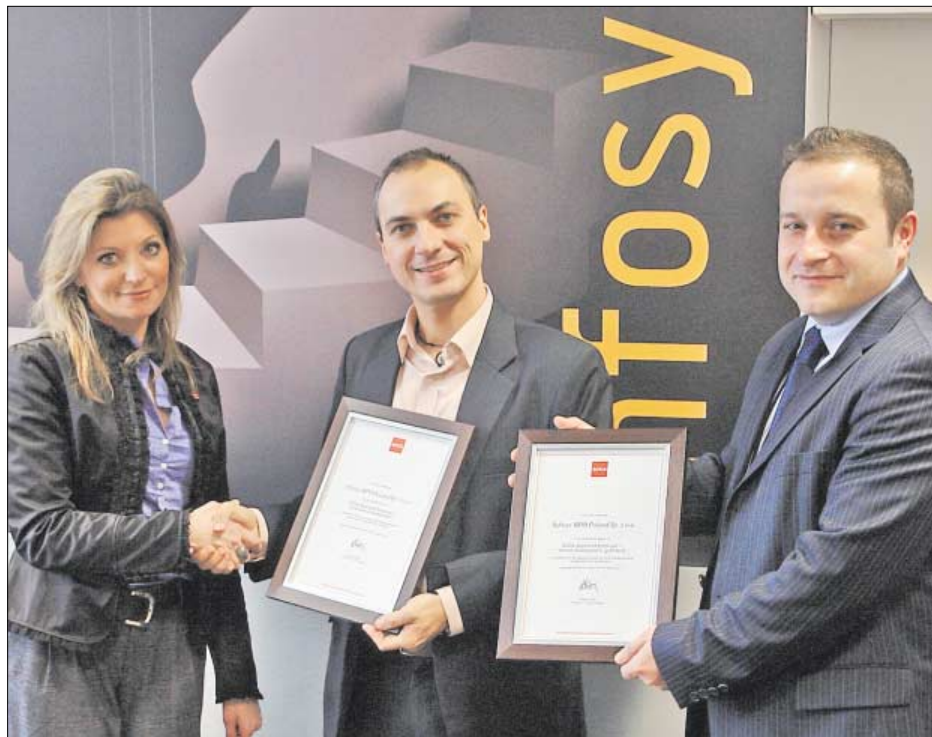
♦ Firma Infosys BPO Poland sp. z o.o. uzyskała akredytację ACCA w 2009 r. (Professional Development, Trainee Development – Gold)

– Przede wszystkim w działach finansowych takich jak księgowość, kontroling, budżetowanie i raportowanie, dział skarbu, dział kontroli wewnętrznej, audytu czy też kon-