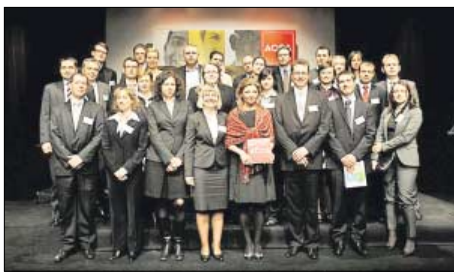
Nowi członkowie ACCA

ACCA jest organizacją członkowską. Oznacza to, że decydujący wpływ na jej rozwój mają jej członkowie. To właśnie oni stanowią największą wartość dla organizacji, to dzięki ich