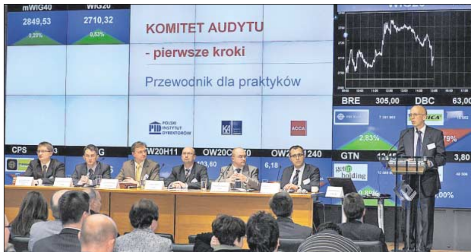
Publikacja „Komitety Audytu – pierwsze kroki. Przewodnik dla Praktyków” po raz pierwszy zaprezentowana została podczas konferencji „Komitet Audytu. Praktyka i oczekiwania”, która odbyła się 26 stycznia 2011 roku w Sali Notowań Giełdy Papierów Wartościowych w Warszawie