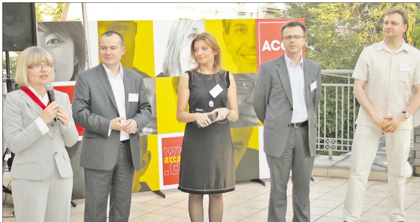
* Oficjalna prezentacja nowego prezydium odbyła się podczas „ACCA Poland Summer Party” w lipcu 2010 roku

Aktywność ACCA na różnych polach, opiniodawstwa nowych rozwiązań ustawowych, promowania zmieniających się międzynarodowych standardów rachunkowości czy standardów pracy biegłych rewidentów będzie wpływać na jeszcze lepsze postrzeganie marki ACCA w Polsce.