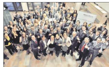
Inauguracja IV edycji programu „Finanse i zarządzanie w biznesie”

Aby wziąć udział w programie „Finanse i zarządzanie w biznesie”, należy przede wszystkim dostać się na studia magisterskie w Szkole Głównej Handlowej w Warszawie. Kluczowym czynnikiem kwalifikacji jest też bardzo dobra znajomość angielskiego, ponieważ wszystkie zajęcia prowadzone są właśnie w języku Szekspira. Doświadczenia