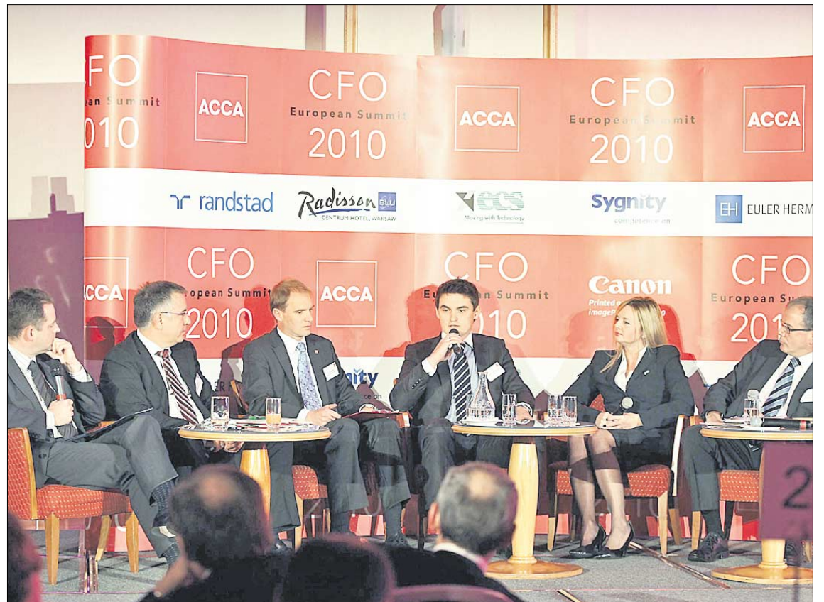
♦ Międzynarodowa konferencja „CFO European Summit” już na stałe wpisała się w kalendarz wydarzeń ACCA. W październiku 2010 roku w Warszawie odbyła się trzecia edycja tego prestiżowego wydarzenia

ACCA nie zapomina o społecznej odpowiedzialności biznesu. Biuro w Polsce od początku swojej działalności wspiera Klinikę Pediatrii, Hematologii i Onkologii Akademii Medycznej w Warszawie poprzez organizowanie akcji charytatywnych. Organizacja ACCA w 2011 roku zamierza się dalej rozwijać i wspierać swoich członków, którzy stanowią olbrzymią wartość i nadają sens jej istnieniu w coraz bardziej wymagającym otoczeniu finansowym.