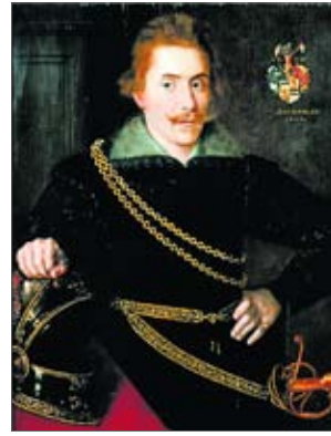
♦ Jakub de la Gardie