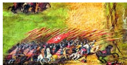
• Zbliżenie: szarża chorągwi husarskiej

Odepchniętego w kierunku obozów nieprzyjaciela ponownie zaatakowano. Karakol (forma walki z użyciem pistoletów i skompli-