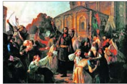
♦ Kuźma Minin wzywa mieszkańców Niżnego Nowogrodu do walki z Polakami w 1611 roku

29 – 30 III – Rzeź wielu tysięcy moskwian. Polacy palą Moskwę. 13 VI – Wojsko Rzeczypospolitej zdobywa Smoleńsk.