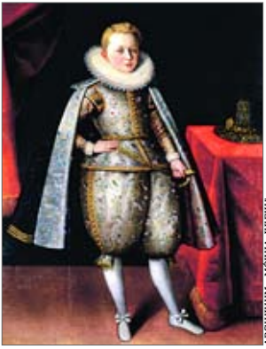
♦ Władysław Waza, portret z ok. 1605 roku