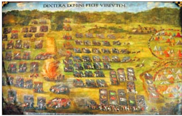
• Cały obraz „Bitwa pod Kłuszynem” pędzla Szymona Boguszowicza (patrz str. 1)