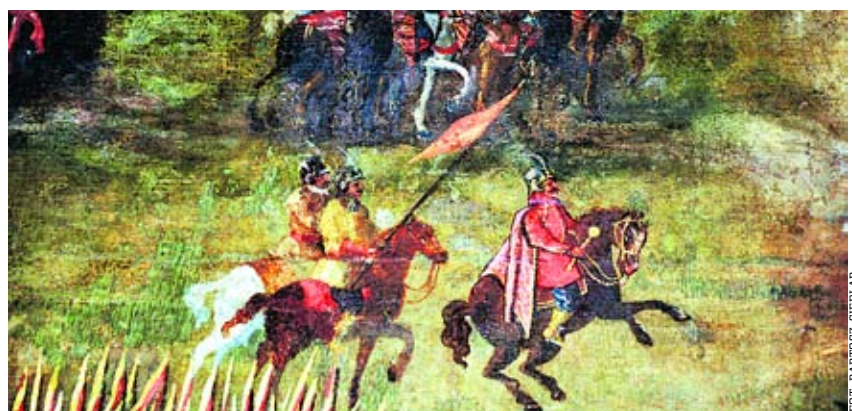
• Zbliżenie z obrazu „Bitwa pod Kłuszynem”: hetman Żółkiewski

Nie było już armii, nie było woli, aby zatrzymać pochód Polaków. Ci ruszyli do stolicy. Rozpoczęto rokowania z bojarami moskiewskimi. Rosjanie obalili Wasyla Szujskiego i obrali królewicza polskiego Władysława Wazę swoim nowym carem. Polacy wkroczyli do Moskwy! ■