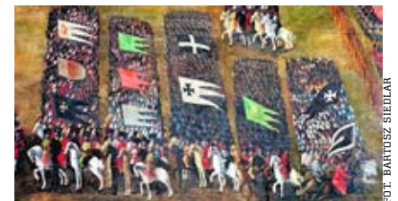
• Zbliżenie: oddział jazdy moskiewskiej

kowanych manewrów końmi) rajтары angielskich przyniósł jednak zgubę i im, i Rosjanom. Rajтары rozbito, a uciekający Anglicy pociągnęli za sobą sojuszników. Większość Polaków rzuciła się w pogoń. Pole bitwy niemal opustoszało. Do pozostałych na nim otworzyła ogień artyleria moskiewsko-szwedzka. Wtedy rozbita uprzednio piechota pikiniersko-muszkieterska wróciła do szwedzkiego obozu. Żółkiewski planował zaatakować go po powrocie swojej husarii z pogoni. Ale zanim jej większość wróciła do boku hetmana, Andrzej Firlej ze swoimi husarzami zaatakował obóz szwedzki. Przedarł się przez otaczające go kobylice (przeszkody antykawalerskie) i rozbił stojących za nimi pikinierów. Jednak nieprzyjaciół było zbyt wielu. Husarze Firleja musieli wycofać się z obozu.