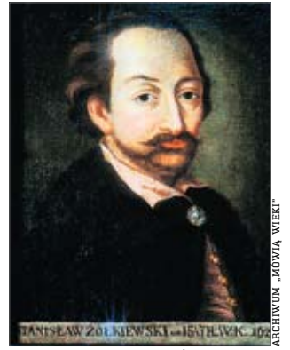
♦ Hetman Stanisław Żółkiewski