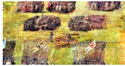
• Zbliżenie: dwa polskie działa, w środku, między chorągwiami

Ponieważ armia przysłana ze Szwecji była znacznie wyższej jakości od armii rosyjskiej, wzięła ona na siebie główny ciężar walk, stając w pierwszym rzucie sprzymierzonych wojsk. Za nimi, po lewej stronie, stanęli Moskwićini.