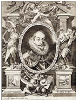
♦ Król polski Zygmunt III Waza