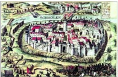
♦ Oblężenie Smoleńska 1609 – 1611

23 IV – Umiera car (w Polsce oficjalnie nie uznawano tego tytułu) Borys Godunow. Nowym carem zostaje jego syn Fiodor II. 20 VI – Śmierć Fiodora II. 30 VI – Dymitr I Samozwaniec wkracza do Moskwy. 31 VII – Koronacja Dymitra I na nowego cara.