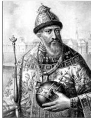
♦ Car Wasyl Szujski, rycina z XIX wieku