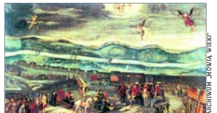
♦ Kapitulacja Michała Szeina pod Smoleńskiem w 1634 roku