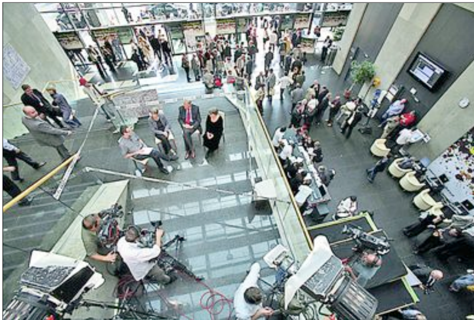
W holu toczyły się debaty telewizyjne

– Edukacja kulturalna jest jednym z największych zaniedbań ostatnich czasów. Musimy przywrócić znaczenie umiejętno-