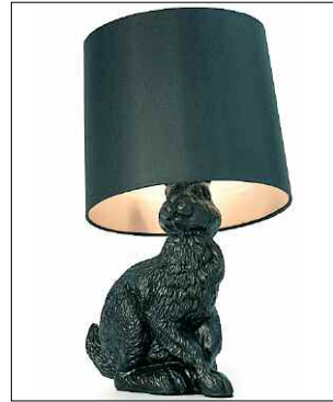
WANDERS: THE MOST WANTED COLLECTION FOR YOUR HOME, ATAK DESIGN