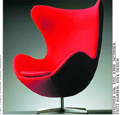
DISCOVER 606, EGG, ARNE JACOBSEN, FRITZ HANSEN, ATAK DESIGN