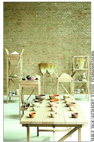
TABLE TALK/AUTARCHY, STUDIO FORMANTASMA

Ich twórcy to raczej współcześni alchemicy niż projektanci. Są to ludzie, którzy w manualnym tworzeniu i emocjach ukrytych w materiale odnajdują mistyczną wartość – uważa Marek Cecuła. – Rzemiosło (craft) – pojęcie powoli odchodzące w niepamięć, niemal już nieobecne we współczesnym słowniku – odsłania znów swoją surową, szorstką wartość na tle nowych technologii i cyfrowych procesów. Dzięki niemu powstaje nowy produkt, który wyróżnia się z nurtu współczesnego designu ciężarem nagromadzonych emocji i wartością swego przekazu. Produkt, którego celem jest wezwanie do dyskusji na temat autentyczności w dzisiejszej przestrzeni życiowej – podkreśla Cecuła.