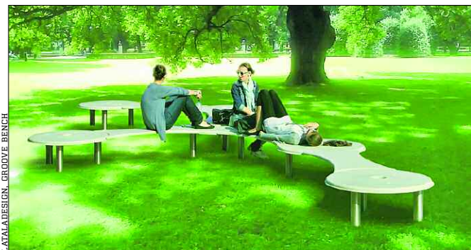
LATAJĄCY DOM. GROUVE BENCH

Przedstawione projekty m.in. grupy kompoff oraz Moomoo Architects, zapropnują rozwiązania czyniące unikalną miejską przestrzeń bardziej atrakcyjną.