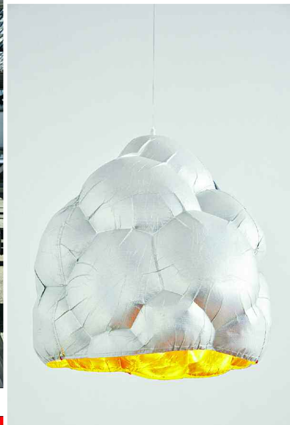
CRUMPLE ZONE. BERTJAN POT. SILVER-CLUSTER LIGHT