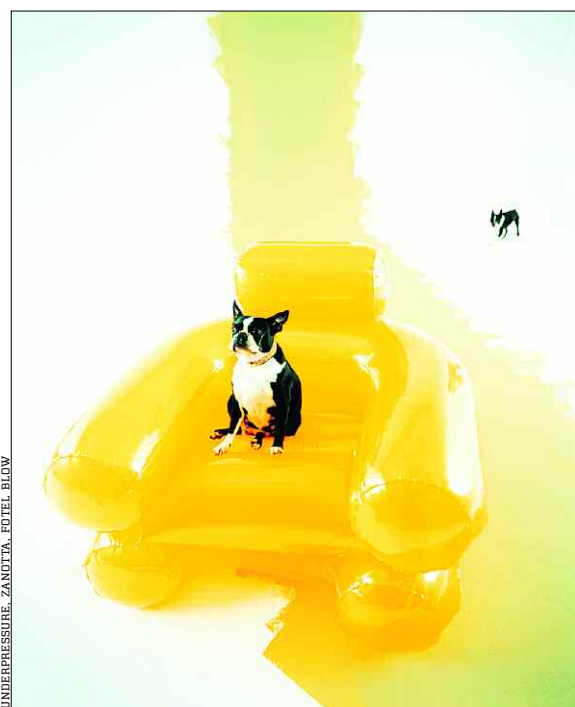
UNDERPRESSURE. ZANOTTA. FOTEL BLOW

Trzy edycje make me! pokazały, jak duże jest zapotrzebowanie na tego typu inicjatywy. Ilość nadsyłanych zgłoszeń rośnie z każdym rokiem. Tegoroczna edycja konkursu wzbudziła bardzo duże zainteresowanie. Spośród 243 zgłoszeń jury wybrało 19 projektów, które stworzą wystawę pokonkursową podczas Łódź Design Festival.