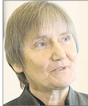
Rolnictwo to ważny kapitał dla kraju. Czy w innych krajach również fraktowane jest po macoszemu i marginalizowane przez środowiska naukowe, gospodarcze?

Natomiast socjologowie odnotowują wyraźny wzrost atrakcyjności wsi, szczególnie po 2004 roku, czyli po wejściu Polski do UE. Z jednej strony wieś chętniej wybrali jako miejsce zamieszkania wykształceni i zamożni mieszkańcy miast, dla których dom w podmiejskiej wsi i praca w mieście to przedmiot marzeń. Z drugiej - wieś jest jak zawsze atrakcyjna także dla ludzi biednych. Własny dom, kilka hektarów własnej ziemi, własna żywność, poczucie godności: „pracuję we własnym gospodarstwie”, to wszystko czyni wiejską biedę co prawda nadal bardziej rozległą, ale mniej degradującą niż bieda miejska. Ludzie zdają się wybierać inaczej, niż sugerują politycy i eksperci.