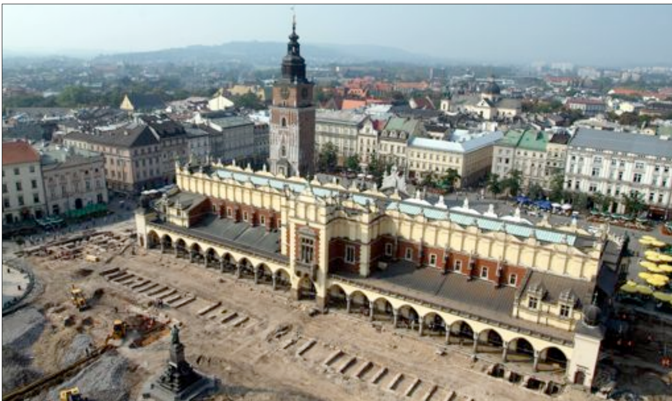
♦ Tak wyglądał Rynek Główny 28 września 2005 roku

Wystawę „Śladem europejskiej tożsamości Krakowa – szlak turystyczny po podziemiach Rynku Głównego” będzie można zwiedzać od 27 września.