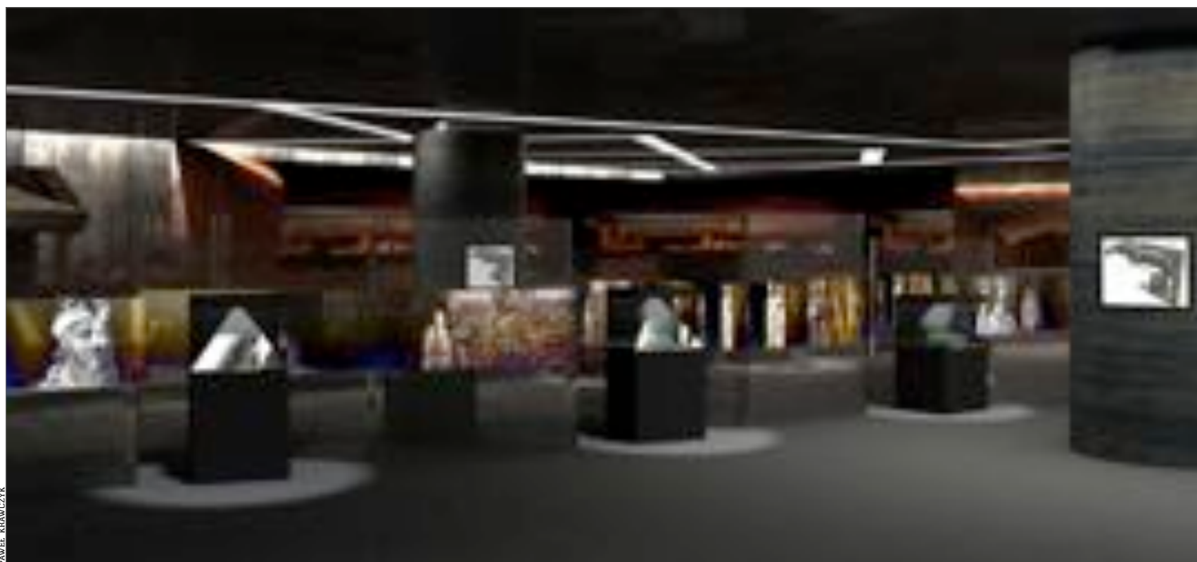
◀Wizualizacja wnętrza podziemnej wystawy