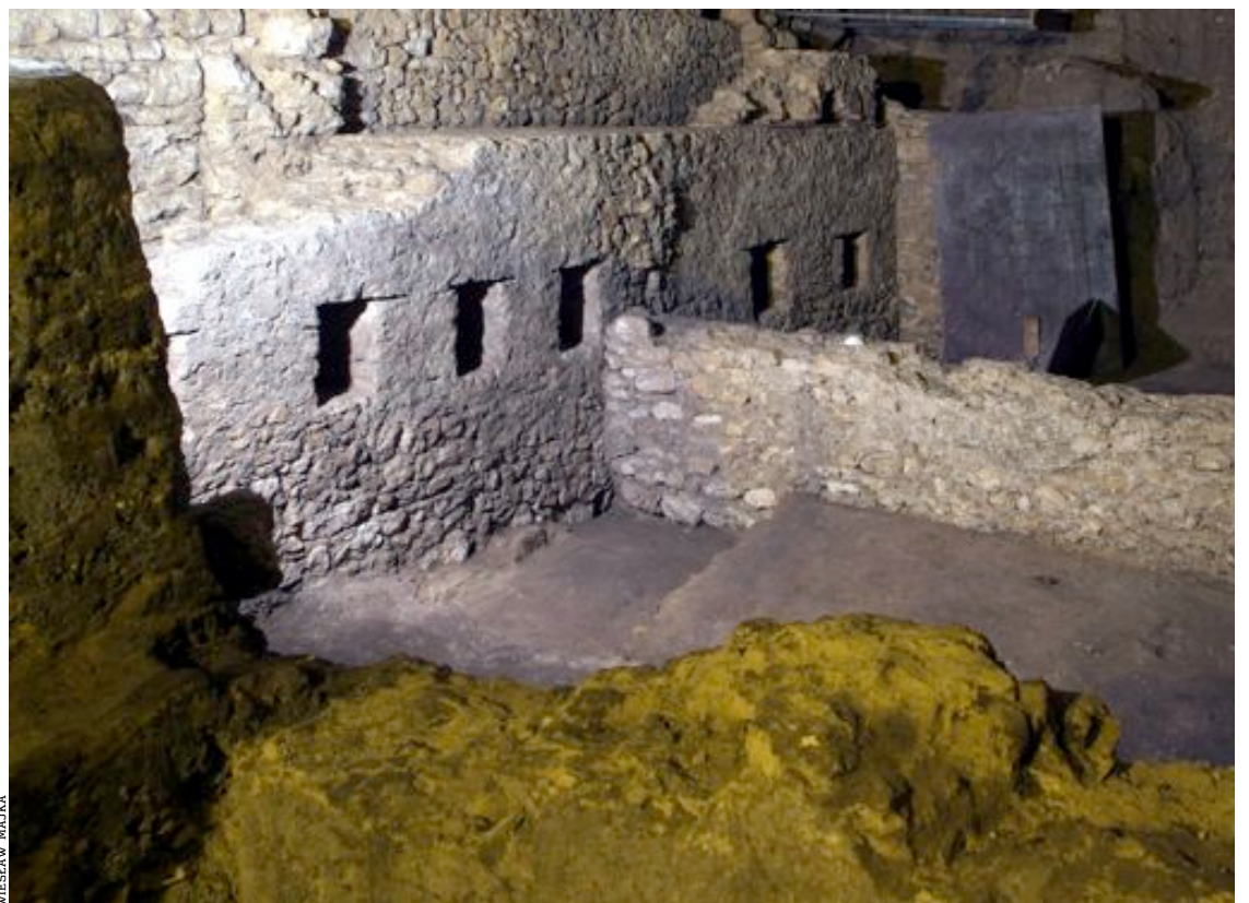
• To, co pod rynkiem znaleźli archeolodzy fantastycznie uruchamia wyobraźnię

Obok autentycznych zabytków przeszłości na wystawie pojawiają się też nowoczesne makiety. Dwie największe – przedstawiające szlaki handlowe średniowiecznego Krakowa oraz zespół miejski Krakowa z 1500 r. – zrealizował Marek Skrobecki, który był scenografem przy oscarowym filmie „Piotruś i wilk”. Wrażenie na zwiedzających robi z pewnością projekcja aktu lokacyjnego miasta, wyświetlana na murach z XIII wieku.