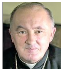
Abp Kazimierz Nycz, przewodniczący Rady Fundacji