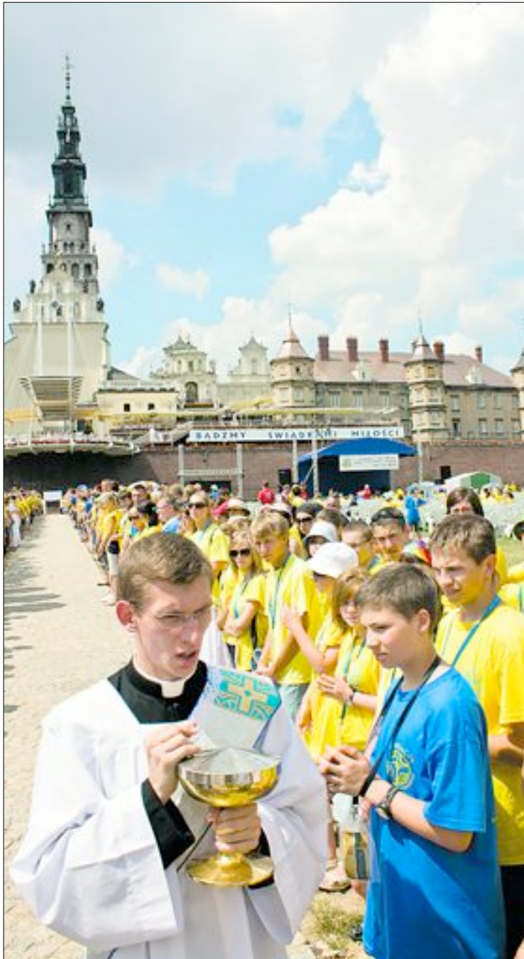
Stypendyści w czasie jubileuszowej Mszy św. na wałach jasnogórskich

„Dziękuję za życzliwość tym, którzy w bliskości kolejnej rocznicy mojego pontyfikatu włączają się w obchody tak zwanego Dnia Papieskiego. Wierzę, że różnorakie celebracje religijne i wydarzenia artystyczne, jakie odbywają się w tym dniu, przyczynią się do głębszego poznania Ewangelii, nauczania Kościoła i wiary, jakie w całej naszej historii łączą wartości religijne i kulturowe. Cieszę się, że dzięki inicjatywie Fundacji Dzieło Nowego Tysiąclecia w tym dniu pozyskiwane są środki na wspieranie uboższej młodzieży przez stypendia naukowe, które pomogą jej lepiej przygotować się do zadań, jakie ją czekają w dorosłym życiu”.