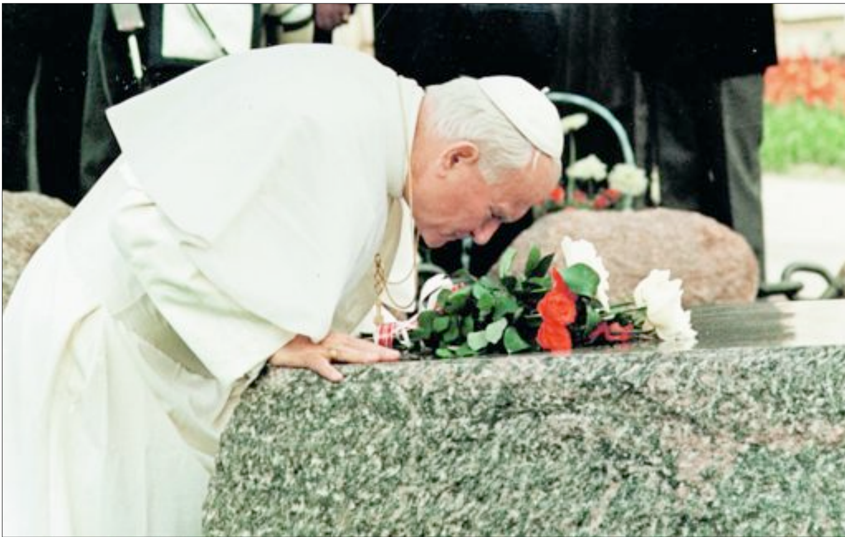
Jan Paweł II u grobu ks. Jerzego 14 czerwca 1987 roku. Modlitwa i pocałunek papieża złożony na płycie nagrobka był jak pieczęć Kościoła potwierdzająca męczeństwo kapłana