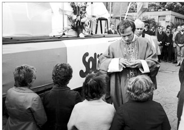
♦ Ks. Popietusko odprawia msze dla strajkujących robotników