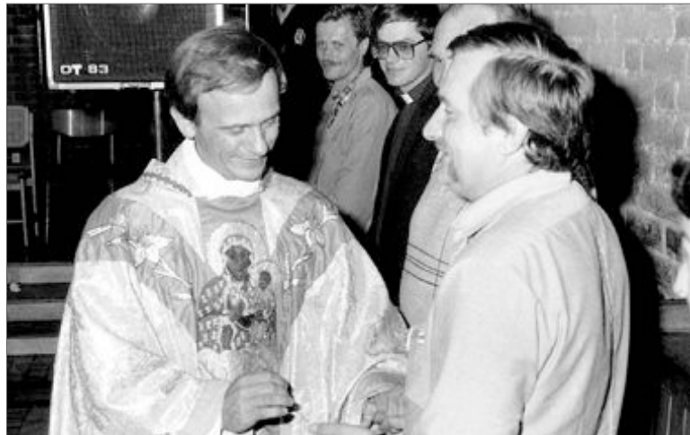
♦ Z przewodniczącym „Solidarności” Lechem Wałęsą