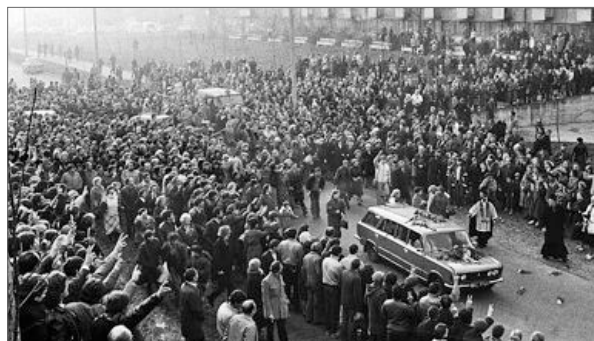
♦ Pogrzeb księdza Jerzego Popietuski. Uczestniczyło w nim od 300 do 500 tysięcy osób