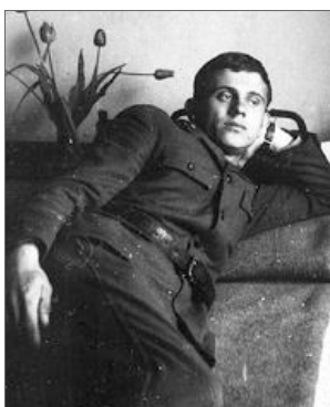
♦ Kleryk Jerzy Popietuszko dwa lata spędził w specjalnej jednostce wojskowej w Bartoszycach