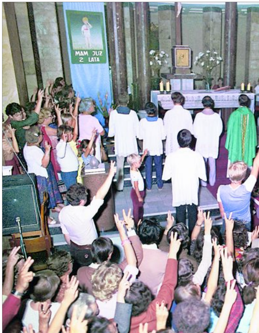
♦ Od lutego 1982 roku ks. Popietuszko odprawiał co miesiąc msze św. za ojczyznę, na które do kościoła św. Sta