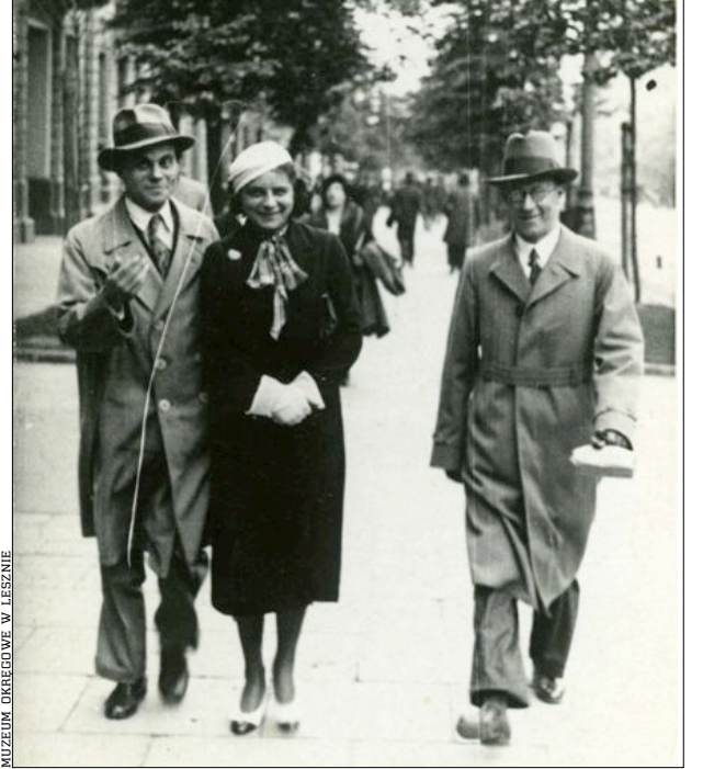
◀ Roman Maciejewski z Grażyną Bacewicz w Warszawie, początek lat 30.