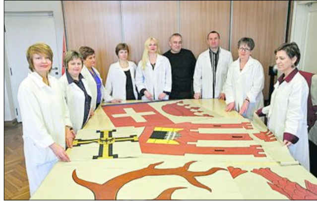
Pracownia konserwacji tkanin Zamku Królewskiego na Wawelu z kopiami chorągwi krzyżackich

Ich unicestwienie w połowie XVII wieku nie zatarło pamięci o wielkiej wiktorii i jej znakach. Jan Długosz postanowił udokumentować 56 teutońskich sztandarów w rękopisie ilustrowanym przez Stanisława Durinka. Kodeks, powstały w latach 1447 – 1448, nazwany „Banderia Prutenorum”, odegrał w następnych stuleciach doniosłą rolę, która sprowadzała się nie tylko do uwiecznienia chorągwianych trofeów. W przesłaniu zawartym w „Rocznikach”, Długosz wezwał