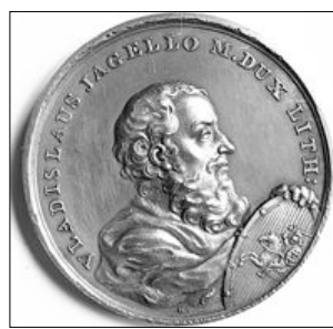
♦ Medal z portretem uznanym za przedstawienie Władysława Jagiełły, autorstwa Jana Filipa Holzhaeussera i Jana Jakuba Reichela