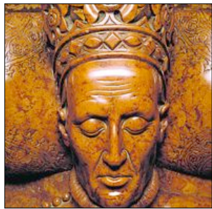
♦ Głowa Władysława Jagiełły, fragment nagrobka; Katedra na Wawelu