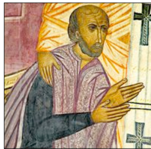
♦ Władysław Jagiełło adorujący Matkę Boską, fragment polichromii, 1418; Kaplica zamkowa w Lublinie