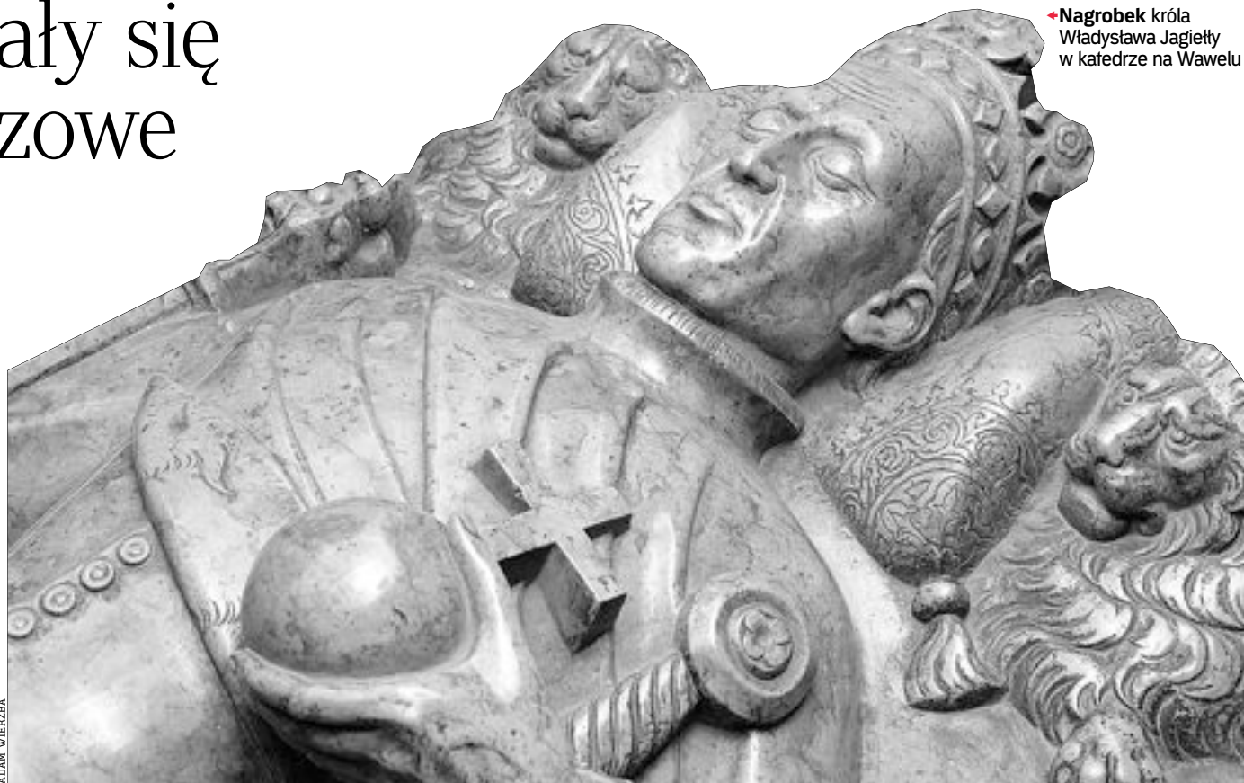
◀ Nagrobek króla Władysława Jagielly w katedrze na Wawelu

Autor jest historykiem, wybitnym znawcą średniowiecza. Emerytowany prof. UJ, od 1994 roku jest sekretarzem generalnym Polskiej Akademii Umiejętności. Przewodniczy Radzie Muzealnej Zamku Królewskiego na Wawelu.