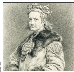
♦ Władysław Jagiełło, Jan Matejko, 1890-1892; Muzeum Narodowe we Wrocławiu