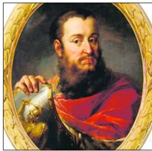
♦ Rzekomy portret Władysława Jagiełły (w rzeczywistości Zygmunta Augusta), mal. Marcello Bacciarelli, Zamek Królewski w Warszawie